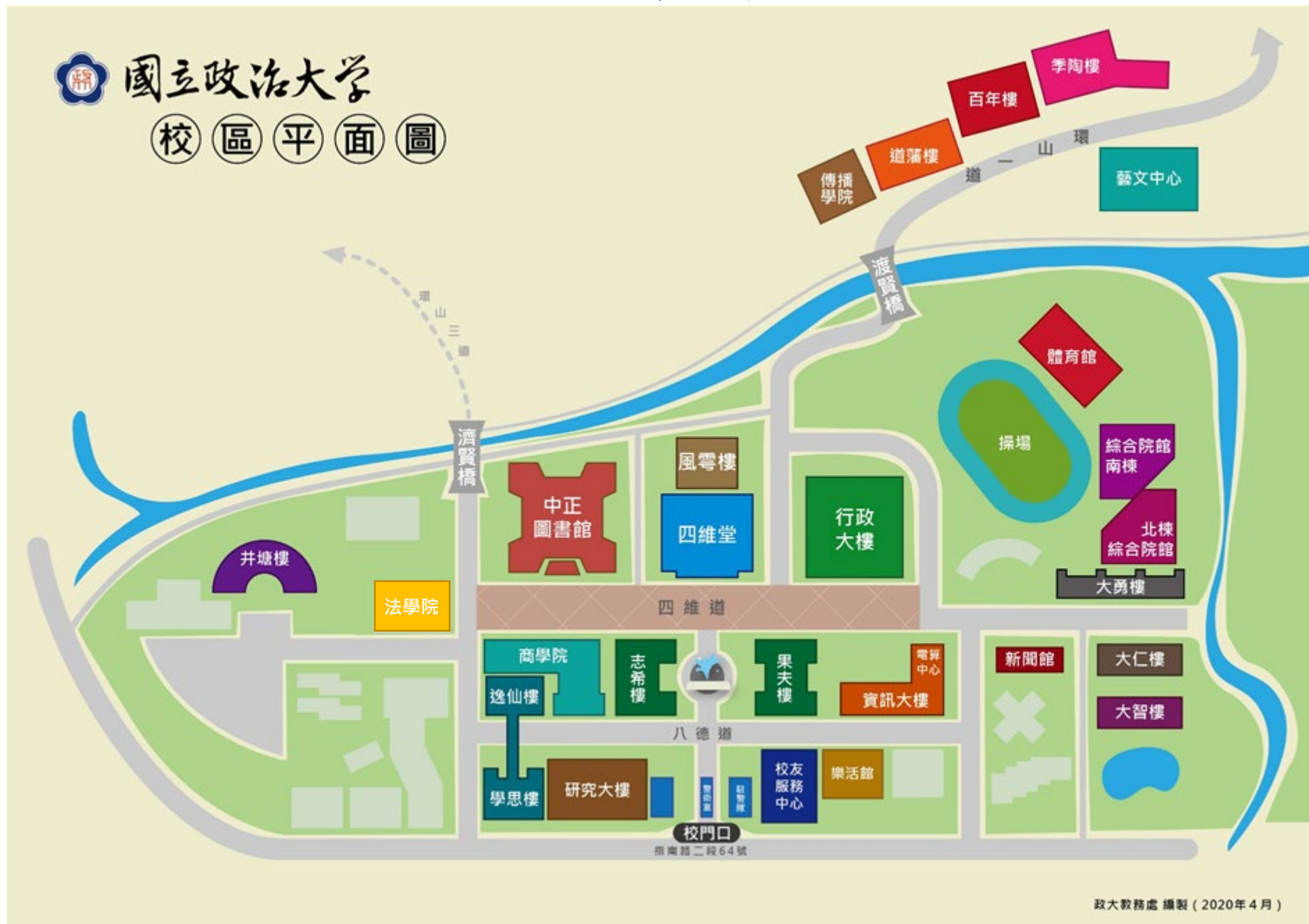
國立政治大學主要建築位置暨週邊道路圖 (校址：116011 臺北市文山區指南路二段 64 號)